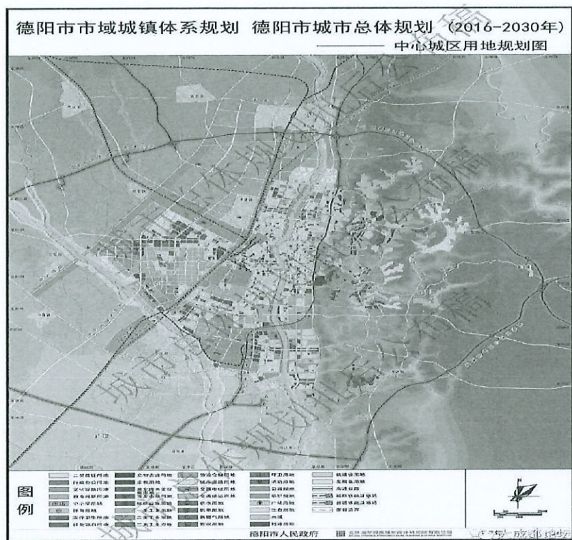
图 1-1 德阳市城市总体规划图